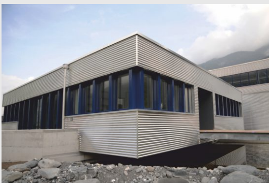
Betriebsgebäude Mollis, Aluminium-Fassade