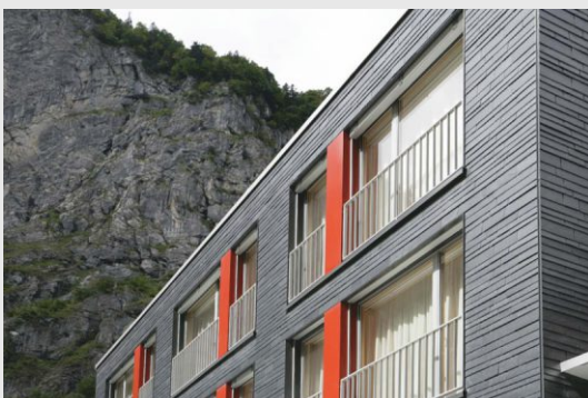
Hotel Tödi, Naturschiefer-Fassade